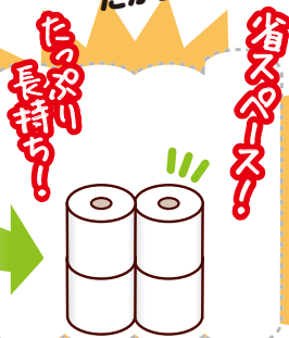
co-op めっちゃ長いトイレットペーパー 225m×4コ=900m